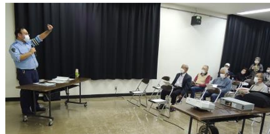
質疑応答に丁寧に応じる講師。