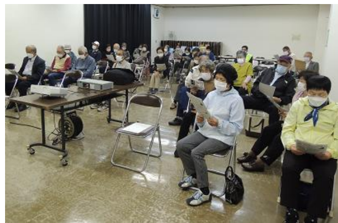
資料を手に熱心に講義を受けました。