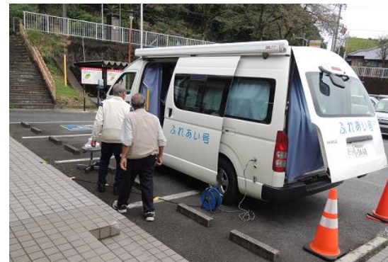
交通安全教育車「ふれあい号」

恒例の交通安全教室、 今年は、高齢者の運転 免許証の更新制度が改 正されました。 学級生には、高齢ドラ イバーも多いため気にか かる人も多かったよう です。