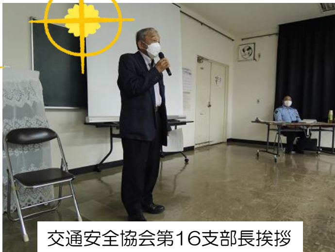
交通安全協会第16支部長挨拶

恒例の交通安全教室、 今年は、高齢者の運転 免許証の更新制度が改 正されました。 学級生には、高齢ドラ イバーも多いため気にか かる人も多かったよう です。