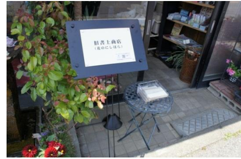
桐生新町散策地図