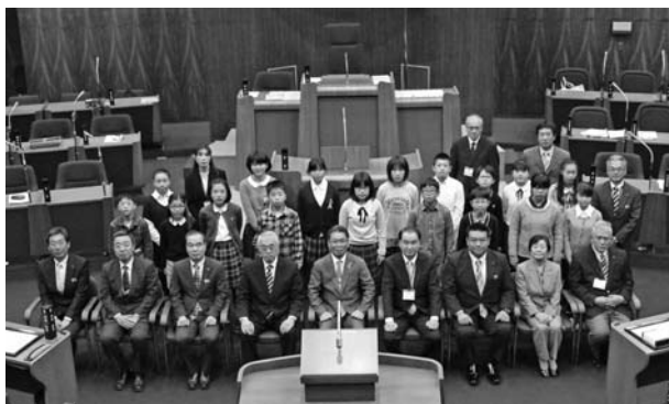
(参加者による集合写真)

市内の各小学校から選ばれた17人の児童が、「『わたしの夢見る未来の桐生』に対する自分の夢、願い、希望すること」を提案し、市政について様々な意見や提案を発表しました。