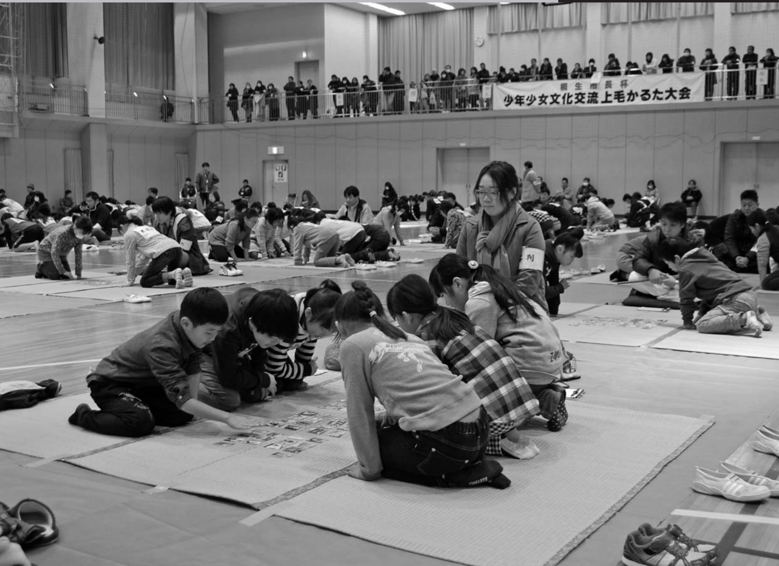
少年少女文化交流かるた大会（北体育館）

平成27年第4回定例会は、11月30日(月)に招集され、12月18日(金)までの19日間の会期で開かれました。