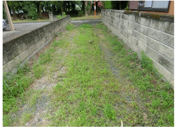
敷地延長部分 幅約3m、長さ約18mある