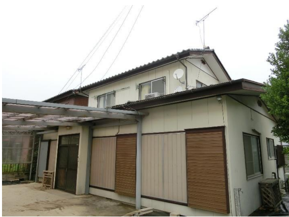
建物外観写真 南向きに建っている