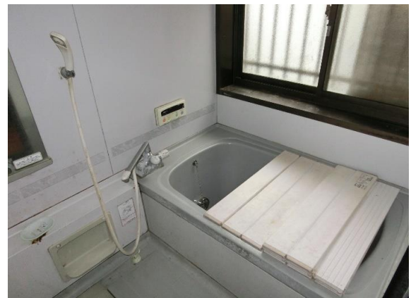
風呂 追い焚き式ユニットバス