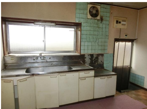
キッチン 約7畳あり、LPガス利用