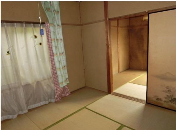
1Fには和室4.5畳×2間と 6畳×2間ある