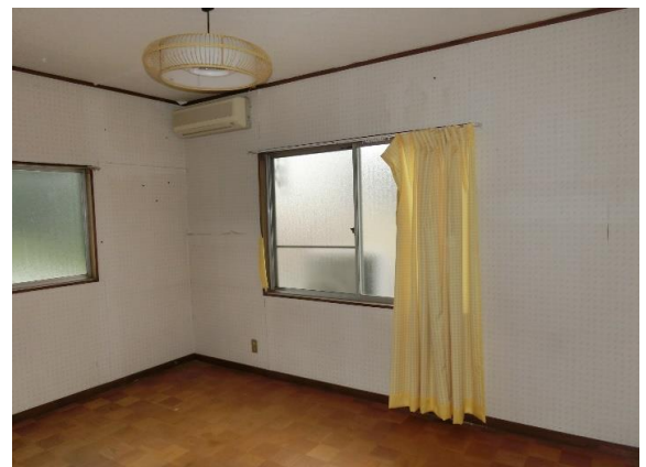
2F洋室6畳 2Fには他、和室6畳ある