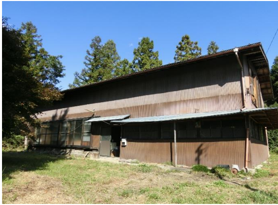
建物外観写真 草葺屋根を葺き替えて金属板葺となっている