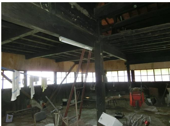
土間 多目的で利用できる約14坪の土間