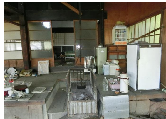
土間からみた小上がり 囲炉裏有り