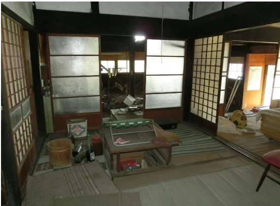
室内写真 和室3間+板張り1間有り