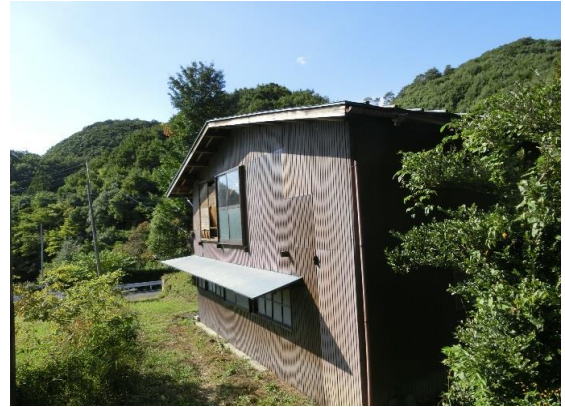
建物から前面道路部分は市街化区域 一段上がった箇所は調整区域となる