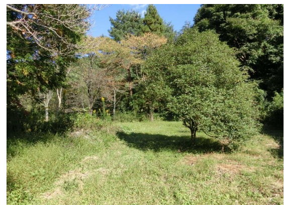
調整区域部分 日当たり良好で広々とした敷地