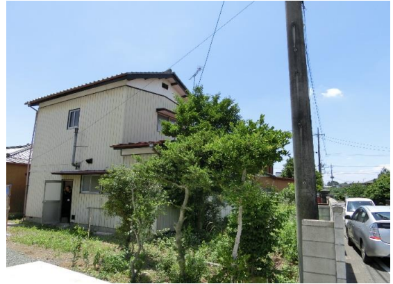
敷地北側より撮影 西側に接道している