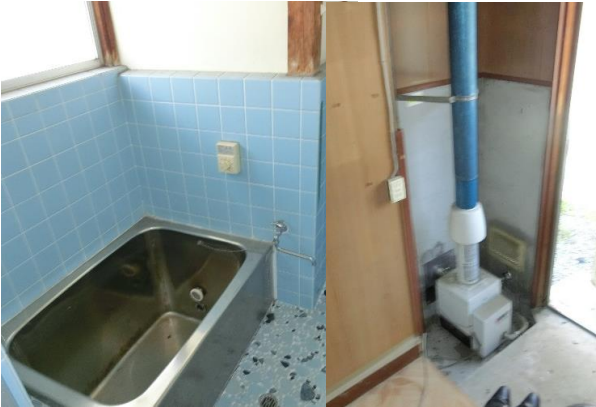
風呂↑ 勝手口↑ バランス釜式風呂