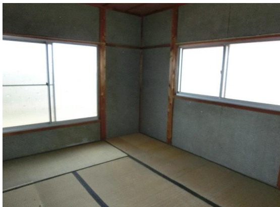
1F和室6畳×1間有り 2Fにも和室6畳×1間有り