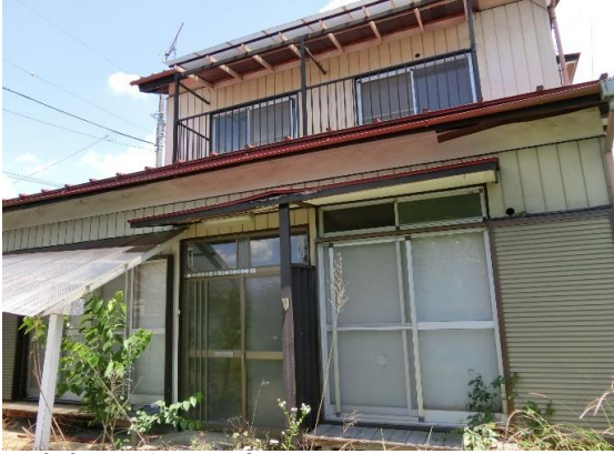
建物外観写真 南向きに建ち日当たり良好