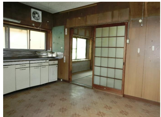
キッチン約4.4畳 LPガス利用