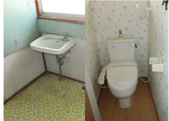
洗面所↑ トイレ↑ トイレのみリフォーム済み