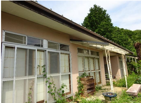
建物外観写真 南向きに開けた高台に立地