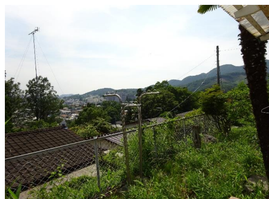
敷地から見える景色