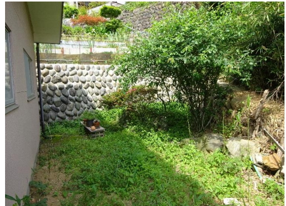
建物東側 庭の向こうは山の斜面となっている