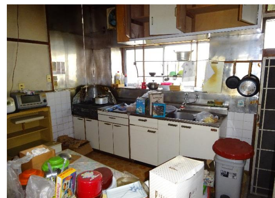
LDK写真 本下水・LPガス利用