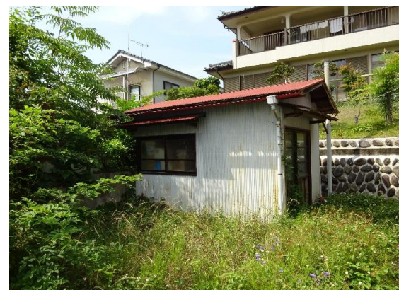
建物西側には物置あり