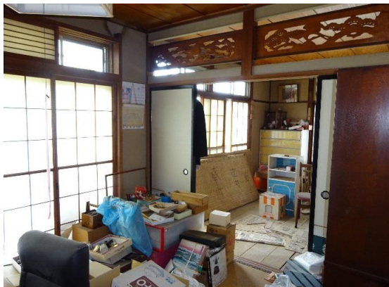
室内写真 奥は和室となっている