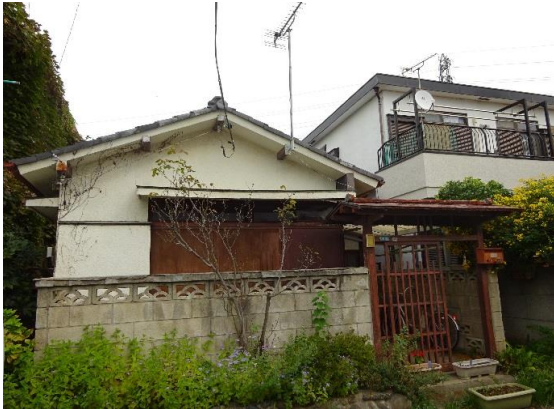
西側道路から見た建物 西向きに建つ建物