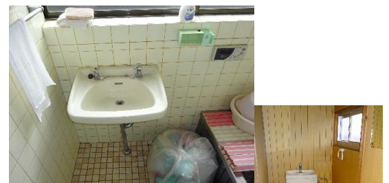
↑ 風呂写真 風呂と洗面台は 同室に有り