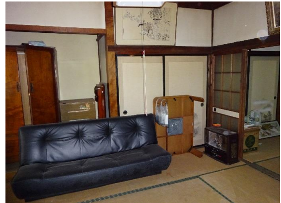
室内写真 和室6畳+4.5畳と洋室8畳有り