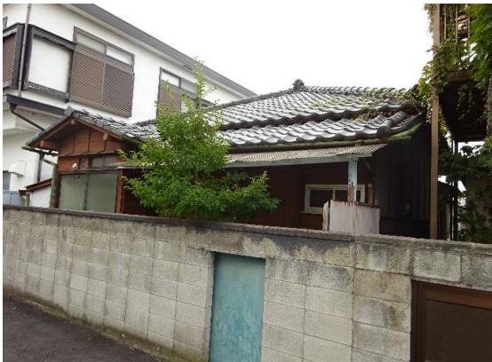
東側道路から見た建物 東・西2方道路に接する