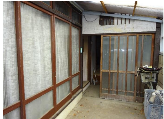
玄関前写真 自転車やバイクを置けるスペース有