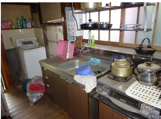
キッチン写真 都市ガス・本下水利用