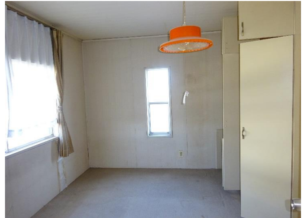
2F和室8畳 他に洋室約9畳+洋室約6畳×2あり