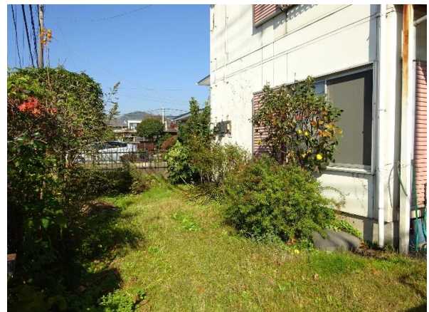
敷地写真 駐車スペースあり