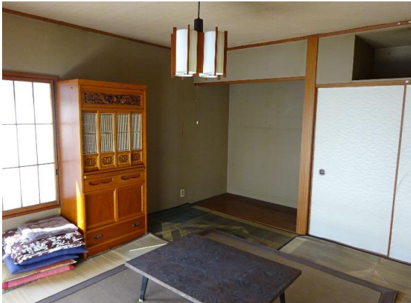
1F和室8畳 他に洋室約8.5畳あり