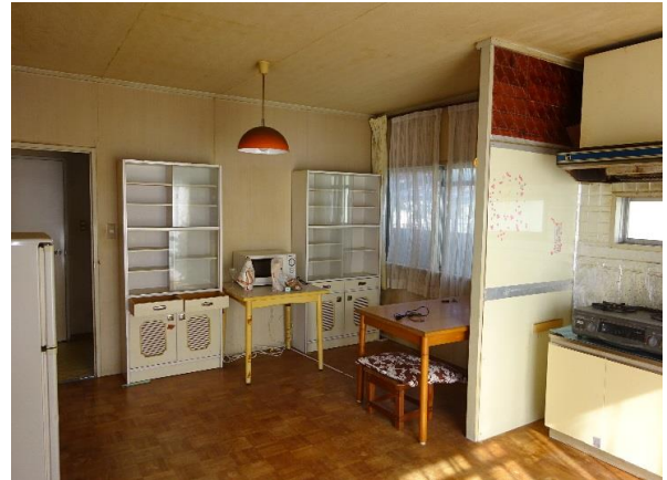
1Fダイニングキッチン約9畳 プロパンガス利用