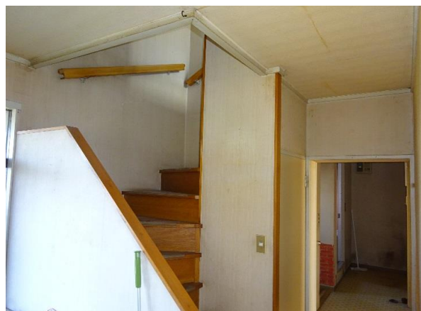
玄関すぐ横の階段 写真右はトイレや浴室に通じる廊下