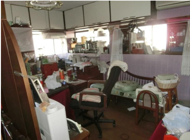
ダイニング・キッチン約6畳