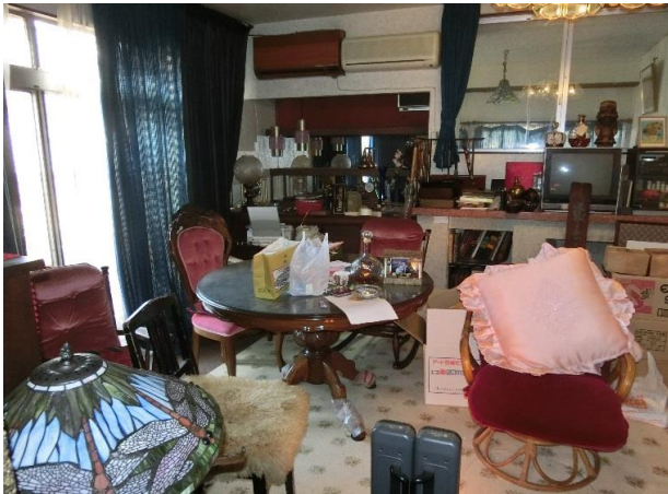
1F洋間約11畳 他に和室4間+洋室2間+茶室あり