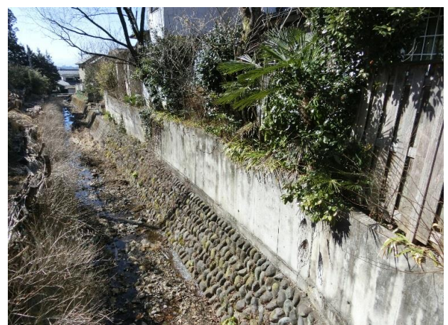
敷地外北側から撮影