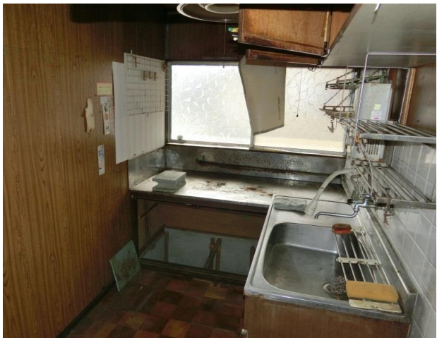
キッチン プロパンガス使用