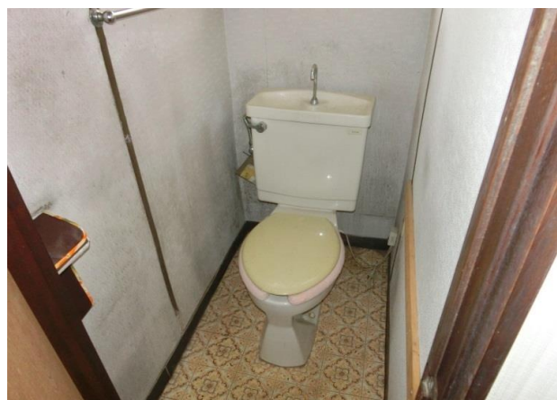
トイレ 本下水使用