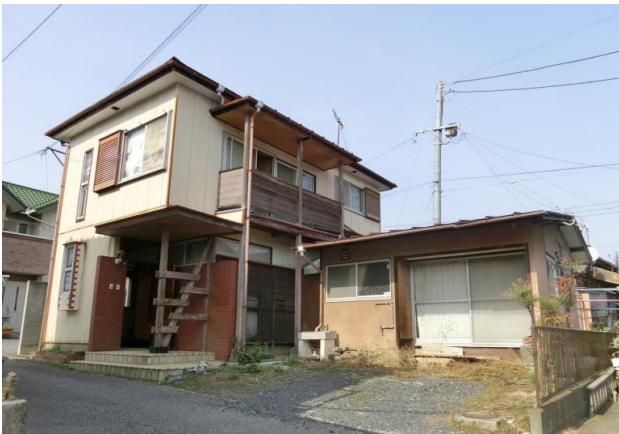
前面私道2項 建替え時セットバック要