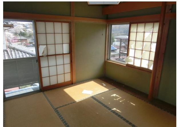
2階西側の6畳和室 隣に4.5畳と6.75畳の洋室がある