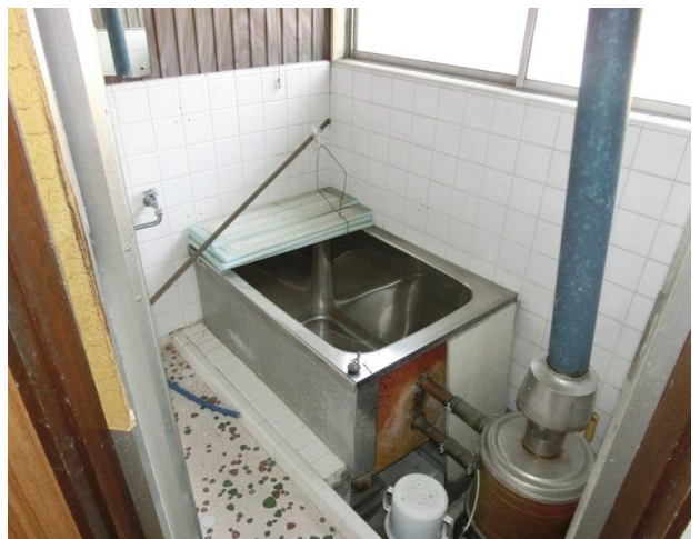
風呂 プロパンガス使用