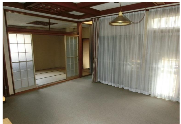
1階10畳の洋室 奥に6畳の和室、右奥はキッチン