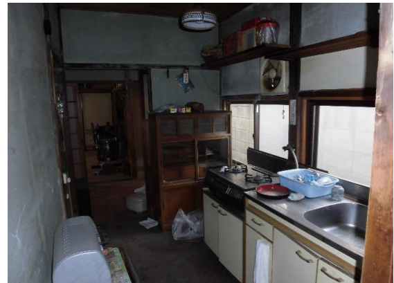
キッチン 都市ガス・本下水利用