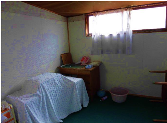
板張り約4畳の部屋 明かり取りの窓有