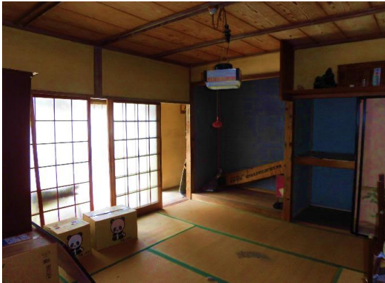
和室10畳 広縁の右奥にトイレ有