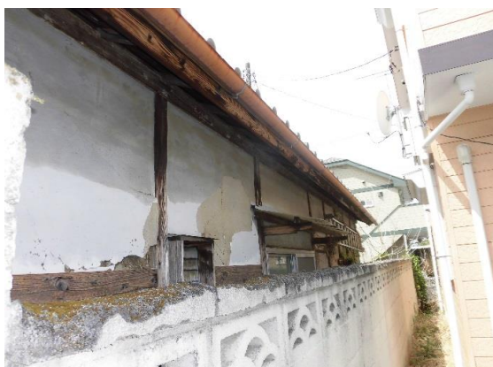
北側隣地境界部分