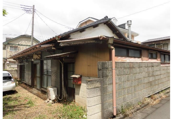
外観写真 駐車スペース有