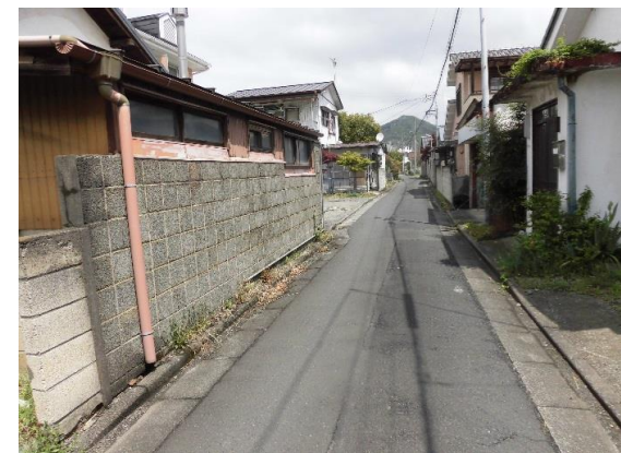
東側道路 2項道路により、狭あい協議が必要