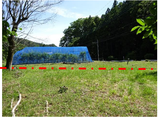
北西道路から見た敷地(点線手前)