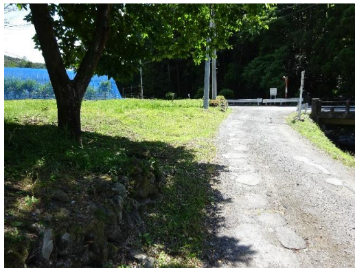
北側から見た敷地 写真右は山田川と鴨押橋