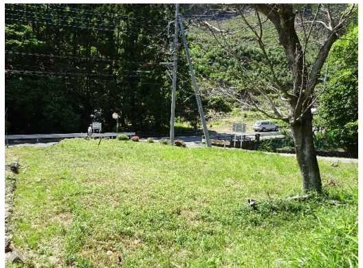
南東側から見た敷地