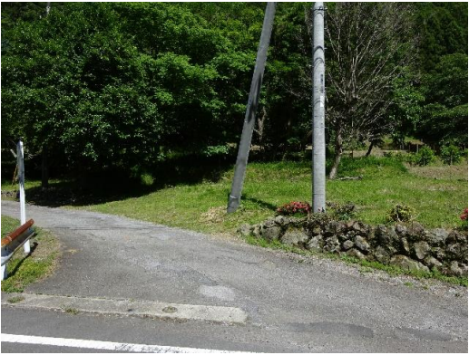
敷地前の北西道路は2項道路となる