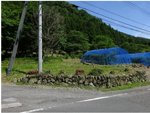
西側道路から見た敷地 石積擁壁の上が敷地