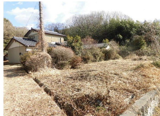
居宅の南側にある農地