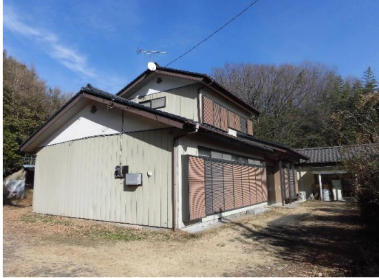
建物外観写真 居宅の奥には物置有り