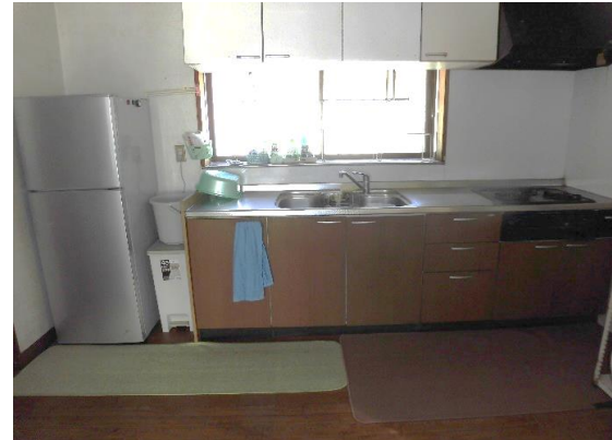
約8畳のダイニングキッチン