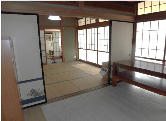
1階の和室8畳二間続き間 ガラス障子の向こうは広縁となっている