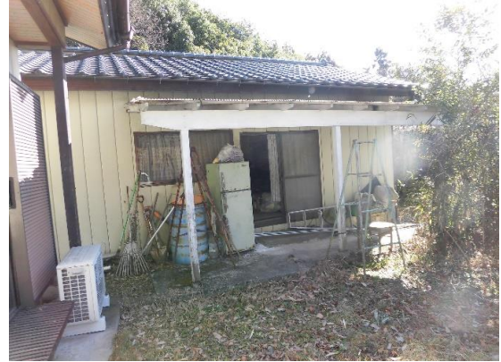
別棟の物置(66.11㎡) 作業場や物置利用可能