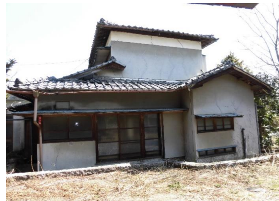
S41年築、128.58㎡の2階建て古家 有り①