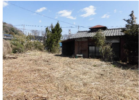
S40年築、33.05㎡の平家古家有り②