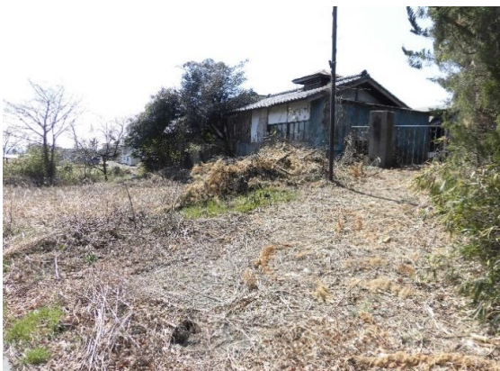
国道353号線に隣接する山林と畑 建物は写真右の平家古家②