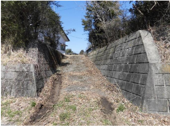
敷地進入部分 2項道路に接する