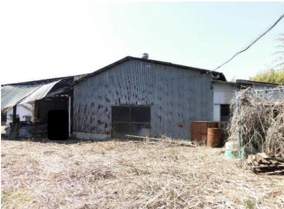
古物置写真 一部底が崩れ落ちている状況