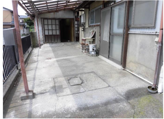
屋根付きスペース 自転車・バイク置き場や物干しスペース としての利用が最適