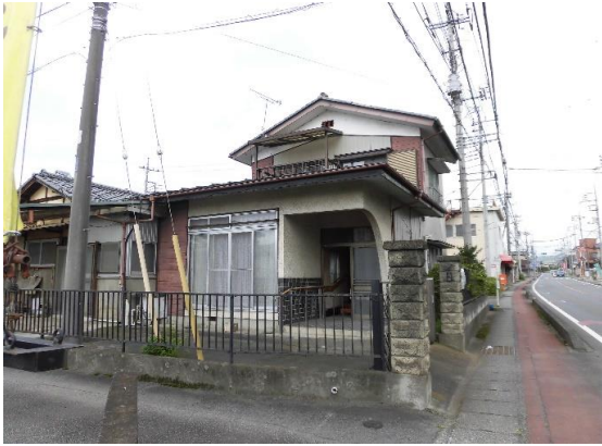
建物外観写真 写真右側の北側道路は国道122号線