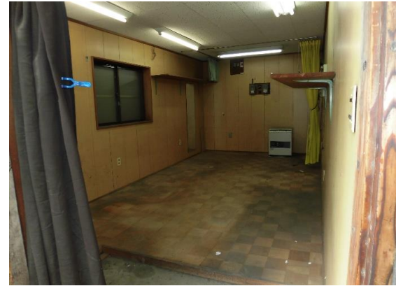
作業場内部 面積14.87㎡の作業場となっている