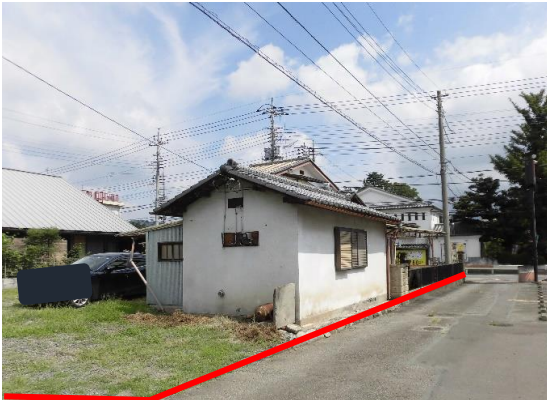
敷地と作業場 南側は2項道路に接する(狭あい協議要)