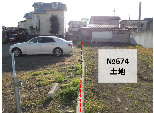
敷地西側境界部分(北側より撮影)