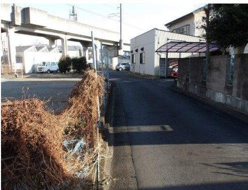
南側道路との境界(2項道路による狭あい協議要)