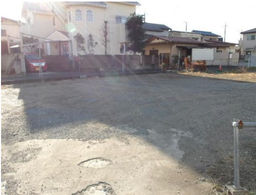
敷地入口から撮影