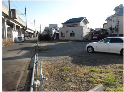
西側から撮影した北側道路との境界