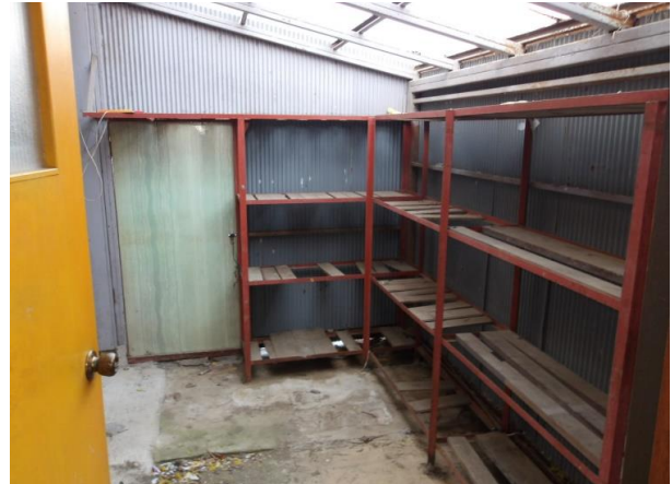
水回り近くに配置されたストックヤード