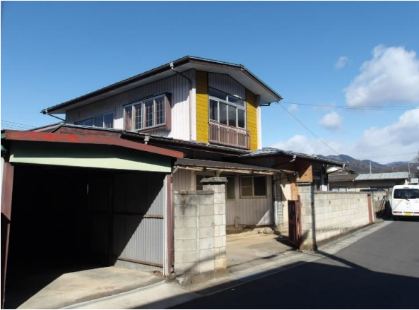
外観写真(東側道路に面する)