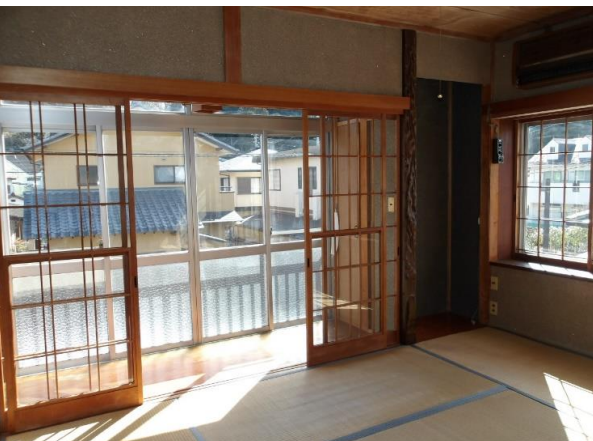
2F和室6畳 日当たりのよい東南側に配置されている