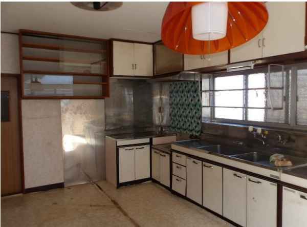
LDK約9畳 下水、都市ガス利用