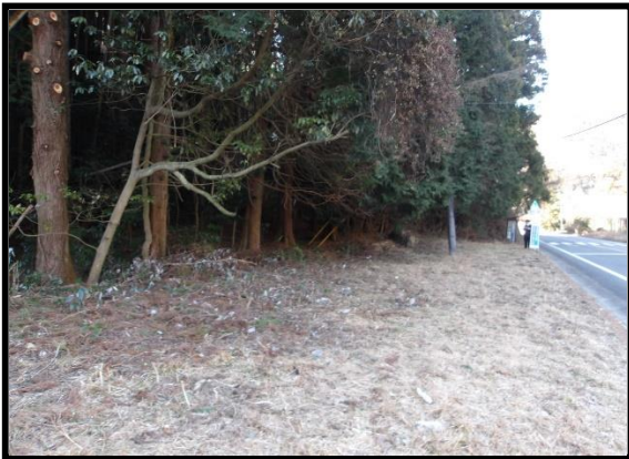
東側から撮影した敷地 (除草されている部分)