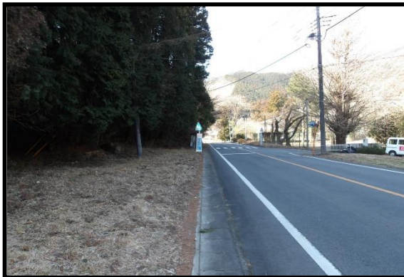
敷地前道路(1項1号)との境界