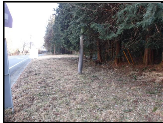
西側から撮影した敷地