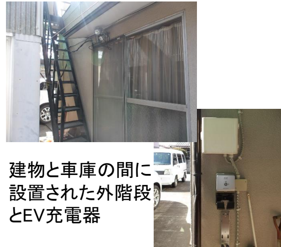
建物と車庫の間に 設置された外階段 とEV充電器