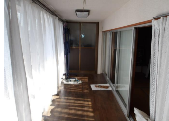
ベランダスペースに増築されたサンルーム 約4.5畳あり、写真正面は押入れ