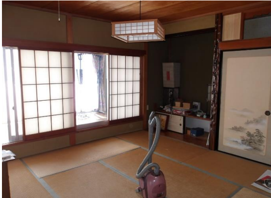
2階には和室と洋室が4部屋あり 写真奥はサンルーム