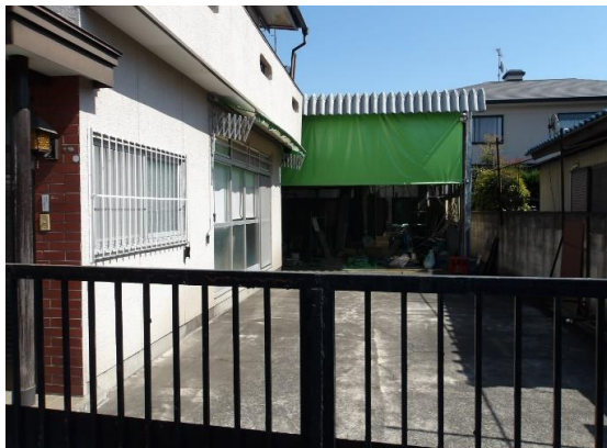
道路からみた敷地部分 正面には車庫兼物置あり