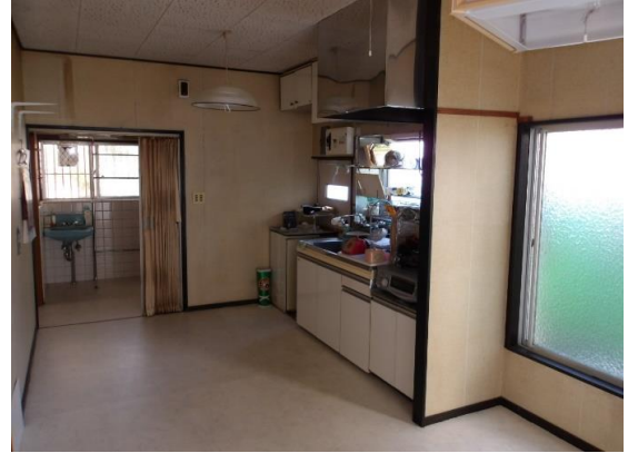
キッチンスペースの奥には 洗面所と風呂あり