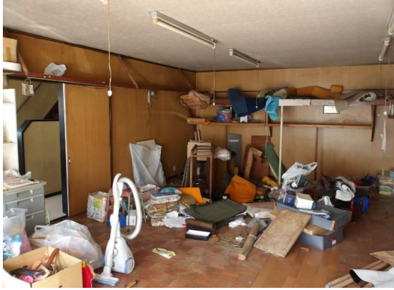
作業スペースはフローリング約24畳