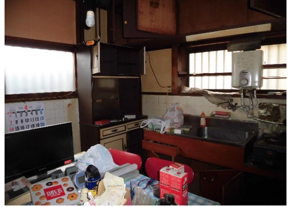
キッチン 湯沸かし器あり、都市ガス利用