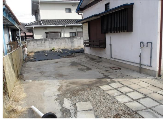
北側道路から見た敷地 縦列駐車で2~3台駐車可能