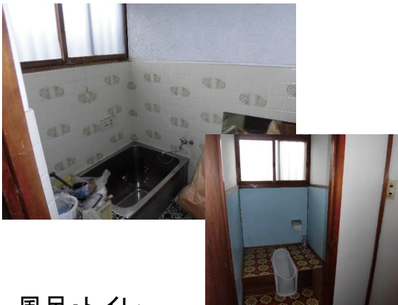
風呂・トイレ 風呂は水から沸かす風呂釜式 トイレは汲み取り式