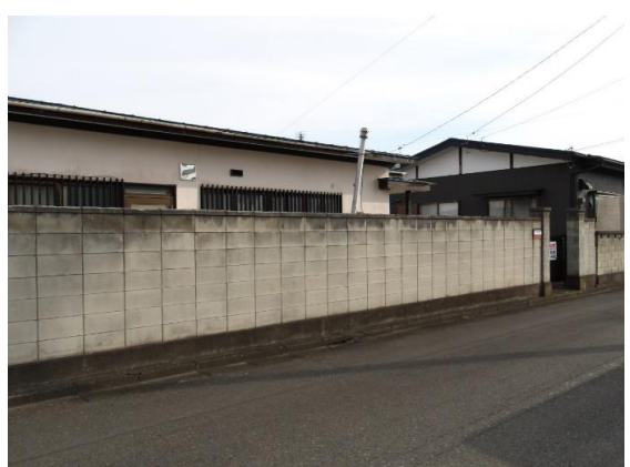
敷地前道路 1項1号道路となっている