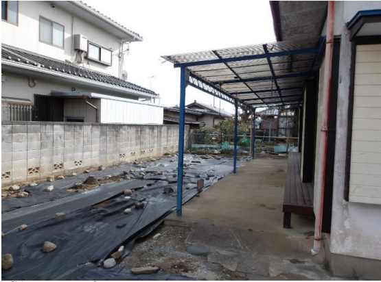
敷地写真 物干しスペースと菜園可能な庭