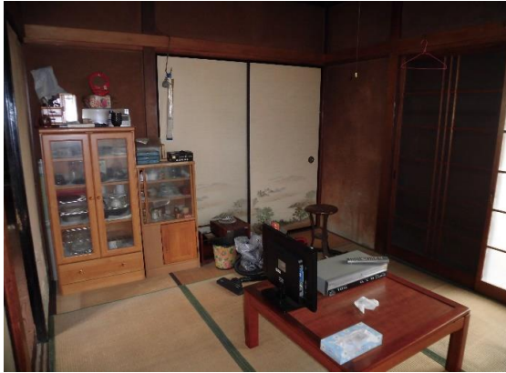
和室 3部屋ある居室はすべて和室