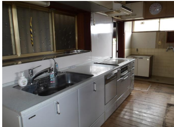
1階キッチン シンク側の窓向こうは物置部分