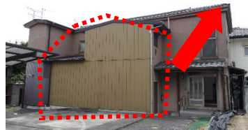
2棟の建物が 重なった部分 が倉庫