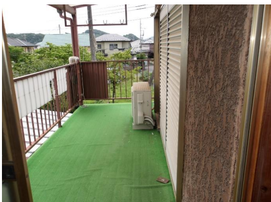
2階のベランダ 建物の東南側に設置されている