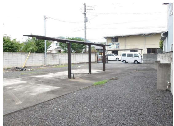
敷地から見た道路とカーポート