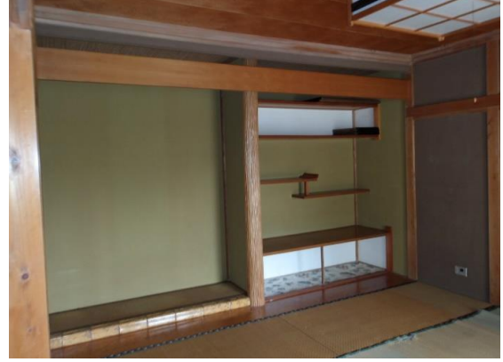
2階和室8畳 ほかに1.5畳の押入れと2畳スペース有