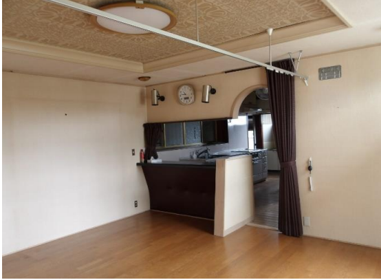
1階リビング約12.5畳 キッチン・風呂・トイレは写真奥に有