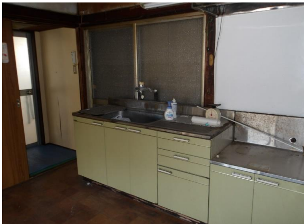
キッチン 都市ガス利用