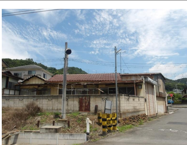
写真右側に『丸山下駅』があります。 左側は敷地前道路