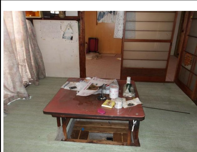
和室4.5畳のほか、和室6畳あり 写真左側にはキッチンがあります。