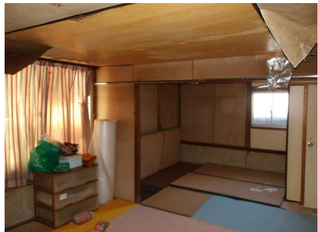
和室約13畳 天井には雨漏り跡があります。