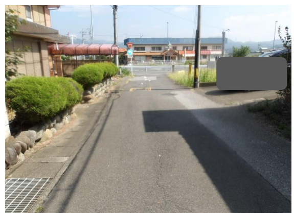
敷地前道路 1項1号道路に面する。その先は国道 50号線となる