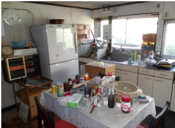
約8畳のダイニングキッチン