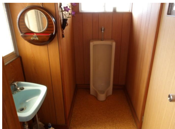
トイレ 写真右扉は洋式トイレあり