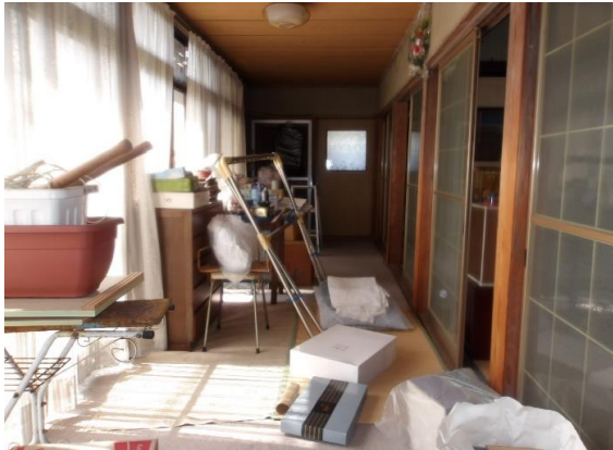
約8畳の広さの広縁(写真奥はトイレ) 南向きに建ち、明るい