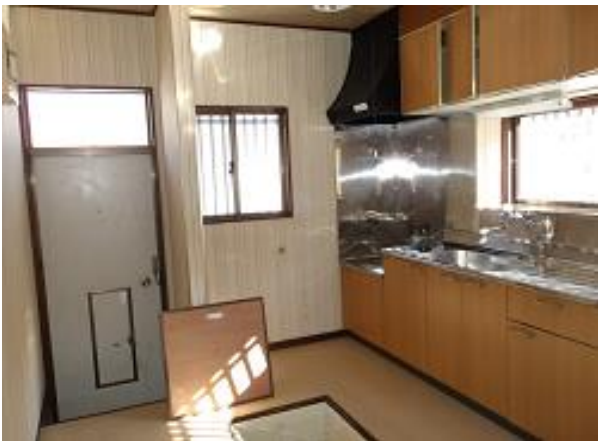
キッチンには床下収納と、勝手口