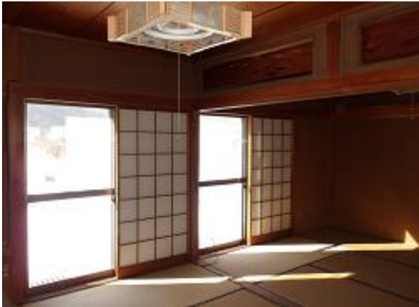
1階6畳の和室は二間つづき