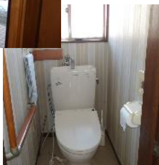
→ ウォシュレット トイレ