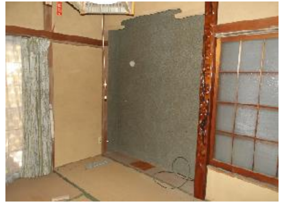
床の間のある和室