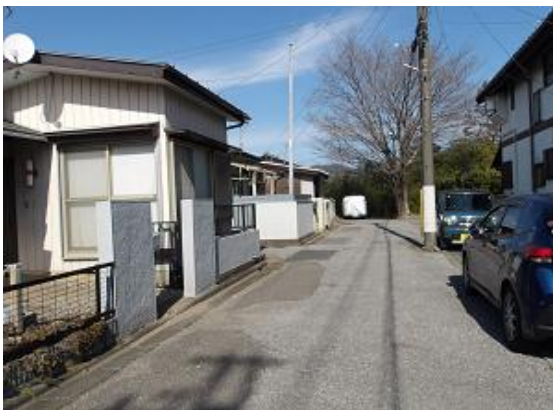
敷地入り口前の道路