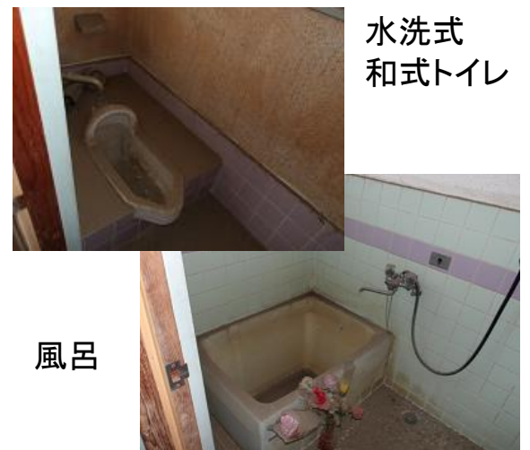
水洗式 和式トイレ