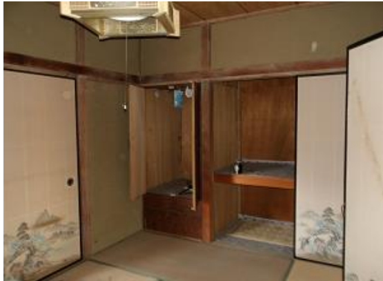
床の間のある和室と二間つづき