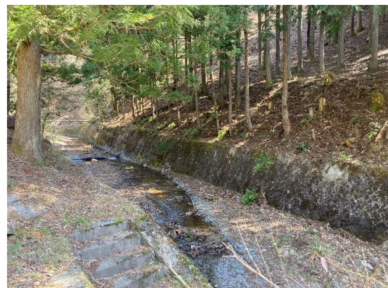
道路下を流れる河川の中川