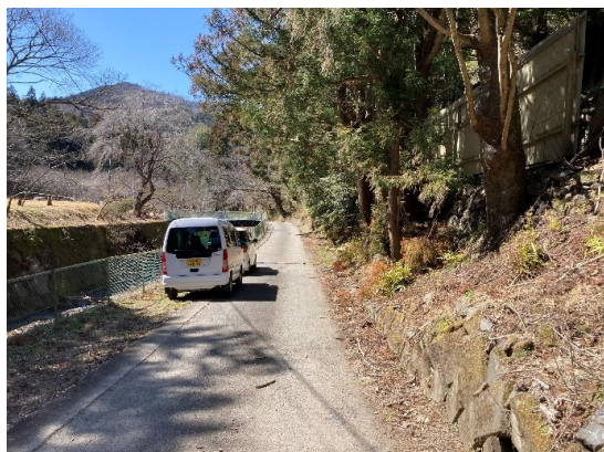
敷地前道路 2項道路となっている(狭あい協議要)