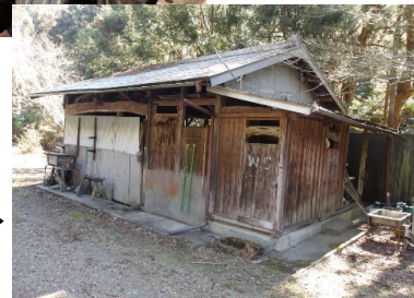
トイレは 別棟の 倉庫隣 →