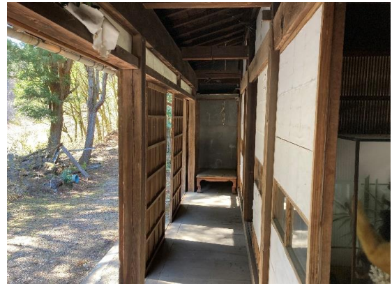
縁側 南東向きに建つ居宅