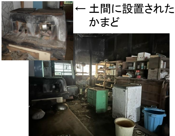
← 土間に設置された かまど