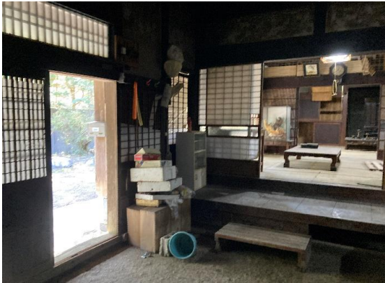
建物入り口の土間 典型的な古民家の間取り『田の字型』