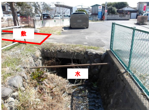
敷地進入部分の床板