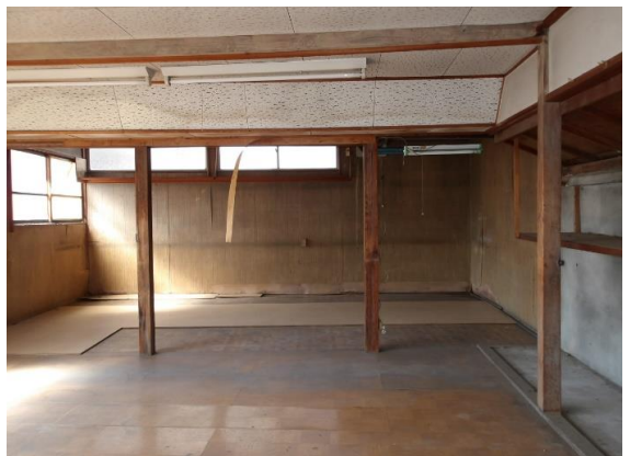
屋根続きの作業場 三相電力を備えた作業場