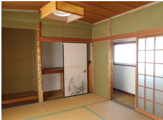
2階の和室8畳 明るく、床の間のある和室