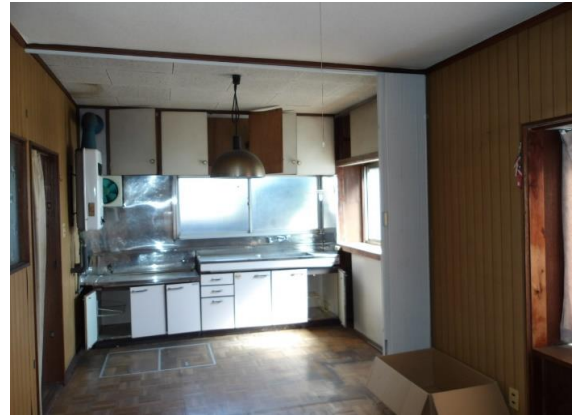
約10畳のLDK アコーディオンカーテンで間仕切り可能