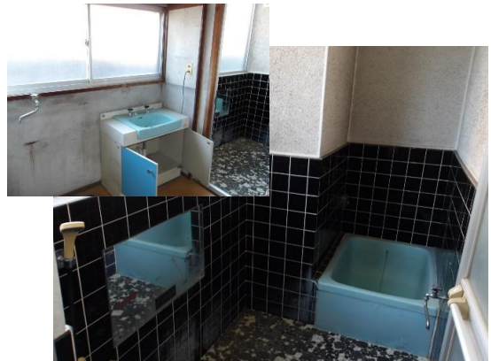
1階の洗面所と風呂