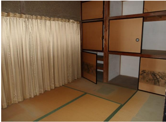
1階和室 南向きに配置された和室6畳