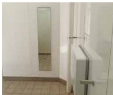
正面が姿見で右がベビーシートです