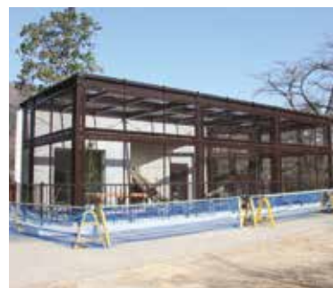
新しいライオン舎の様子