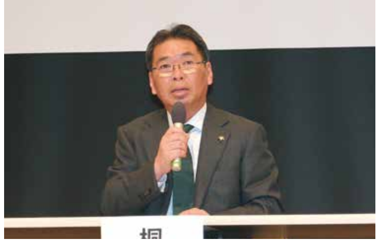
研究成果のまとめを説明する市長

3月10日（木）に市民文化会館シルクホールにおいて、桐生・みどり新市建設研究会の研究成果について、市民説明会を開催しました。 市長は、「今後、両市においては、人口減少や少子高齢化の進行に伴う歳入の減少に加え、公共施設の老朽化による大規模改修や建替えなどの課題も多く想定され、この地域が将来にわたり持続可能なまちとして発展していくためには、ひとつの生活圏を形成する両市の合併が必要不可欠である」と強調しました。