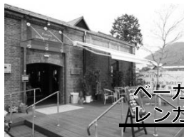
ベーカリーカフェ レンガ