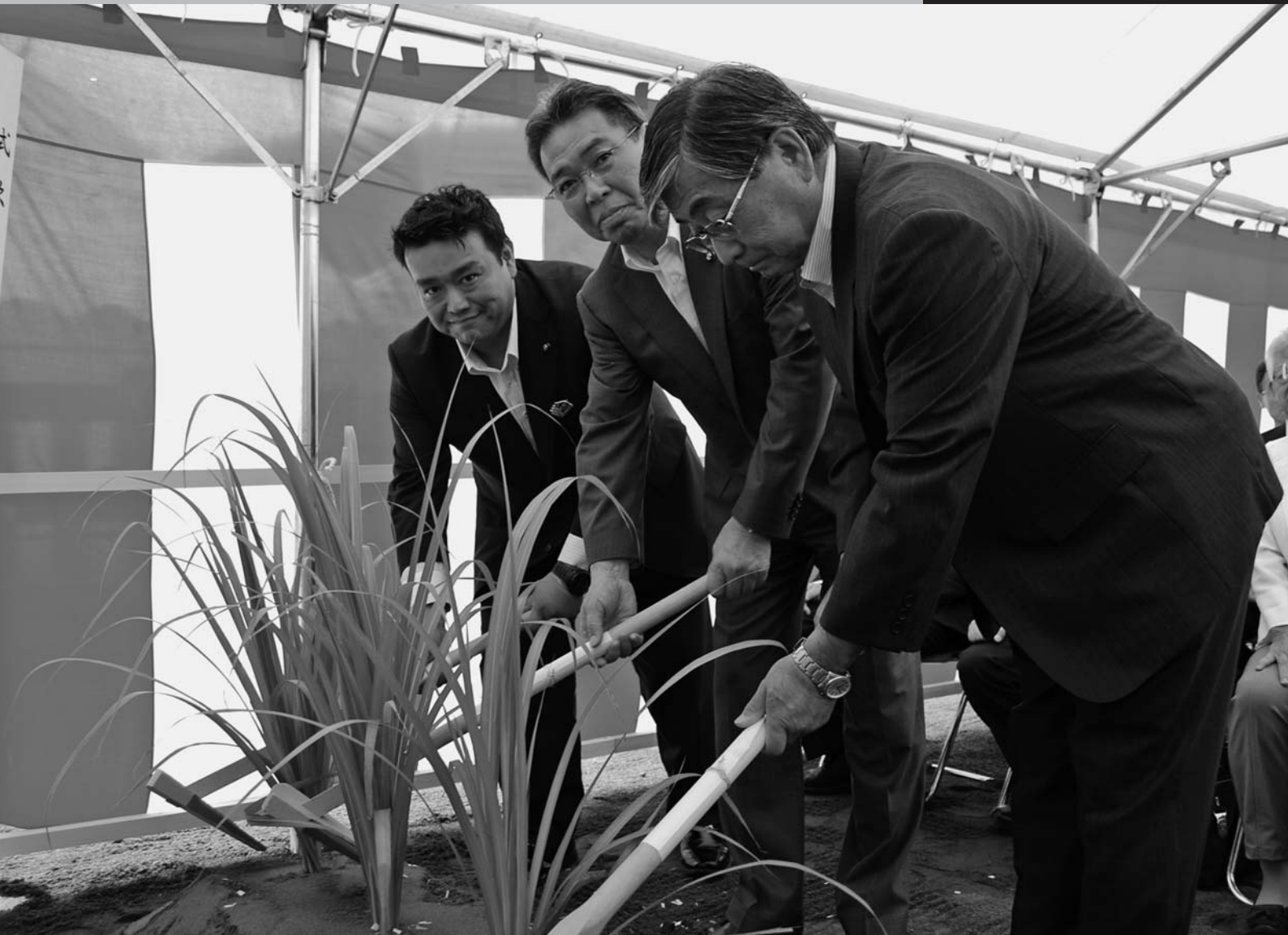
(仮称) 梅田浄水場起工式での鍬入の儀

平成28年第2回定例会は、5月30日(月)に招集され、6月17日(金)までの19日間の会期で開かれました。