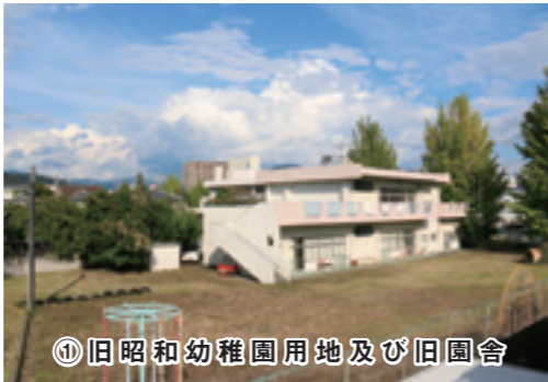
① 旧昭和幼稚園用地及び旧園舎