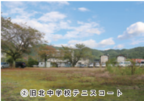
② 旧北中学校テニスコート

販売物件は、①旧昭和幼稚園用地及び旧園舎、②旧北中学校テニスコートの2件です。物件の概要は、下の表のとおりです。