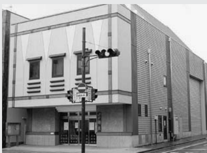
(あーとほーる鉢座)

答弁 本施設は、観光振興の観点からも極めて重要なものであるが、国・県・市から多額の補助金を受け、民間団体が建設した施設を、市が引き受けることは極めて困難である。現在、今後の運営方法や支援体制等について、関係者による協議