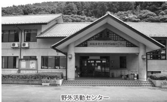
野外活動センター

場所の移動などが実施済みで、受付時期の繰り上げなどは現在検討中である。また、今後はアンケート調査を行い、結果を分析することで市民サービスの向上を図りたい。