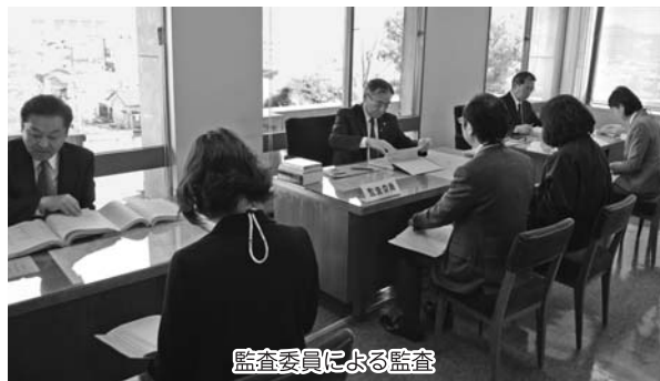
監査委員による監査