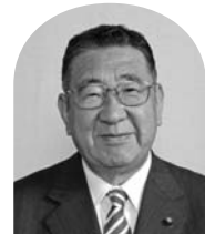
関口直久 (日本共産党議員団)