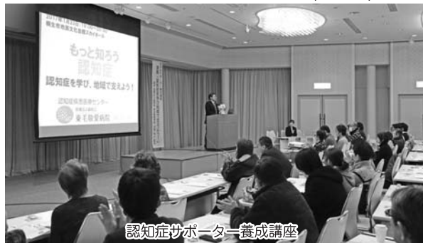
認知症サポーター養成講座

これまで小学校や中学校、警察関係者、生命保険会社など、幅広い年齢層で約1万1500人が受講している。成果の例として、認知症サポーターの小中学生の協力により、認知症の高齢者が無事帰宅となった。子供たちは、学校で養成講座を受講しており小さなサポーターが力を合わせ成し遂げた成果である。このような積み重ねにより認知症の人が住み良い地域になっていくものと考えている。