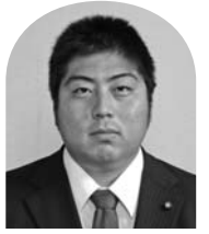
渡辺 恒 (日本共産党議員団)