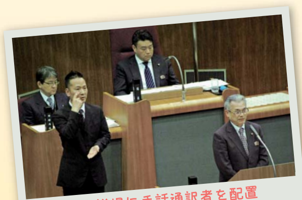
本会議場に手話通訳者を配置