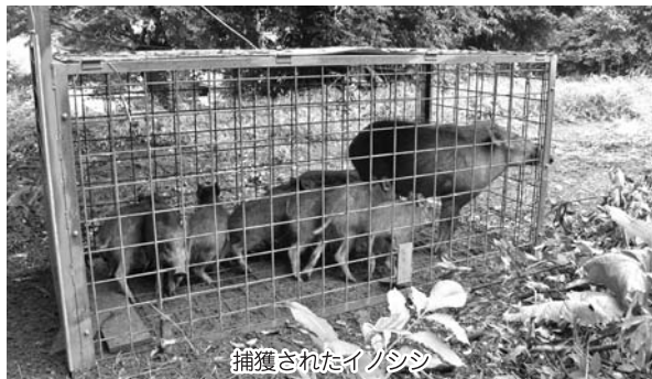
捕獲されたイノシシ

県ではイノシシの捕獲目標を7500頭から1万3000頭に上方修正しており、市の平成28年度の捕獲頭数は前年度より71頭増加した。有害鳥獣に対する特効薬となる解決策は難しいが、捕獲による個体数の調整、生息環境の整備、また柵設置の補助等を行うなど積極的に取り組んでいきたい。