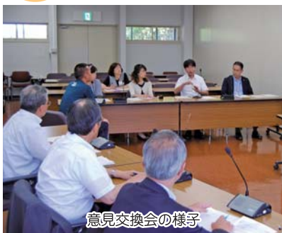
意見交換会の様子

全国的に「手話言語条例」を制定する動きが広がる中で、教育民生委員会では、手話が言語であるという認識に基づいて、全ての市民が共に生きる地域社会を実現するため、新たな条例制定に向けて協議を重ねました。