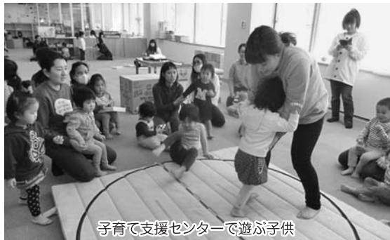
子育て支援センターで遊ぶ子供

そのご家族が集まり、周辺の商店等との結びつきが深まる形になれば、大きな波及効果が期待できるものと考えている。また、子供が多く集まる拠点ができることで、子育て関連の新店舗等が集まってくるという期待もできる。市としては、空き店舗活用型の支援制度等を積極的にPRする中で、子育て関連店舗の開設を促進していきたい。今回の屋内遊戯施設の開設が、末広町商店街の活性化にも役立つものになるよう、両者の効果的な融合を推進したいと考えている。