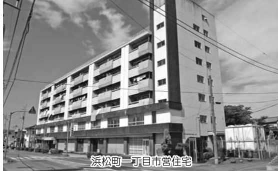
浜松町一丁目市営住宅

市営住宅の改修については、当初長寿命化計画に基づいて進めていたが、本市の人口減少問題や現在策定中の「桐生市