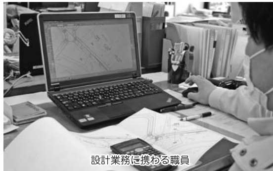
設計業務に携わる職員

思うような危険をまうような危惧をしている。新里町は新しい住民が増加する傾向にあり、武井西工業団地造成に伴う関連工事も進んでいる。また、中山間地域特有の課題を抱える黒保根町も、旧桐生市内とは全く違った地域環境にある。それらを踏まえると、現場目線で地域性に合わせた対応を