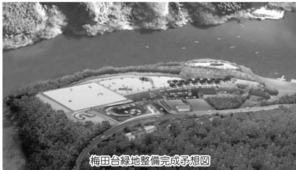
梅田台緑地整備完成予想図