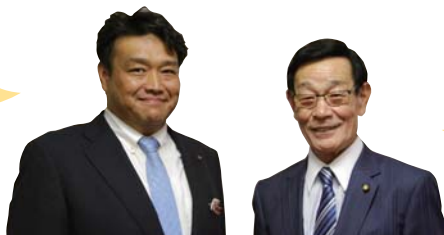
森山 享大 議長

今後も議員22名と事務局一丸となって、「いちばん身近な頼れる議会」をモットーに掲げ、地方創生時代に相応しい議会として、桐生市の持続的発展のため、専心努力を傾注して参る所存です。今後ともご支援をよろしくお願い致します。