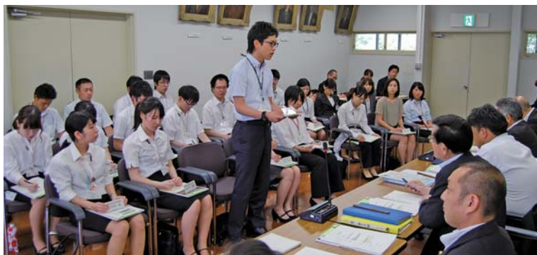
新採用職員との意見交換