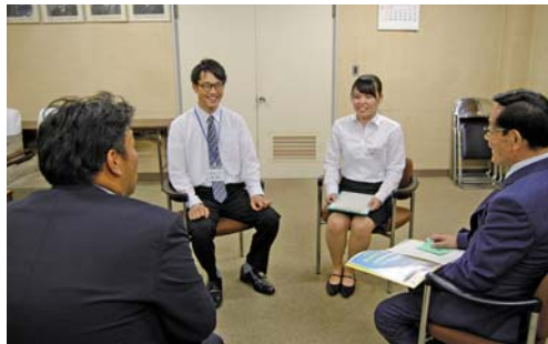
実習生との意見交換

市民の皆様におかれましては、平素より議会活動に関しまして、深いご理解と温かなご支援を頂いておりますことに、心より御礼を申し上げます。我々、桐生市議会は市民の皆様から頂戴した議員としての職責を全うするため、日々、議会改革に取り組んでおります。