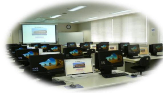
写真は入替前のパソコンです

OA研修室のパソコンが新しくなりました!(Windows11・Office2021)