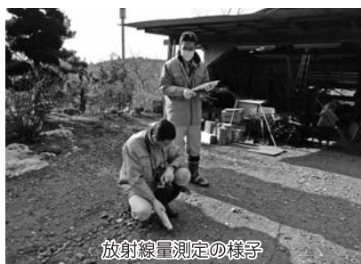
放射線量測定の様子

活支援施設の設置及び管理に関する条例第 条の規定に基づき、桐生市黒保根高齢者生活支援施設の管理を行わせるため、社会福祉法人泰和会を指定管理者として指定しようとするもの。