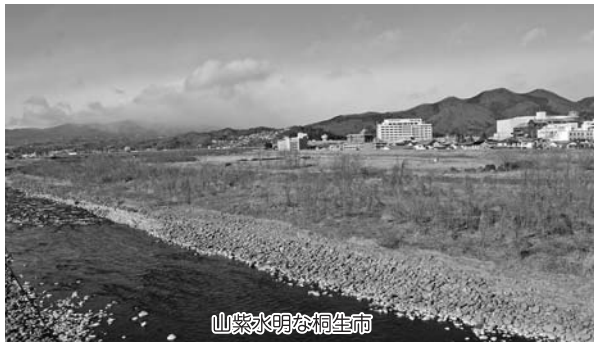
山紫水明な桐生市

市としては、施行規則に基づき、事業者には地元説明会を実施していただき、隣接する土地所有者や地域住民の同意を得た上でその記録などを提出するよう指導しており、実施した説明会の関係書類や自治会の同意書の添付を求めている。なお、自治会の同意においては、自治会印の捺印が必要である。また、事業計画画地周辺住民の同意がない場合、申請は受理していない。