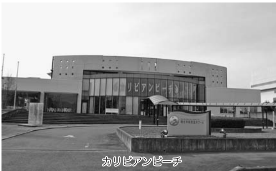
カリビアンビーチ

入館料は、平日小・中学生が300円、土日祝日及び7月日から8月 日までの期間は500円である。他市の無料券については太田市の場合、とうもうサマーランドの閉館に伴い、3歳から中学生までの太田市民の入館料を無