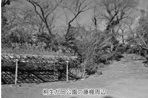
桐生が岡公園の藤棚周辺

桐生市の保有する23億円の基金を中長期的に活用し、市民の負担が上がらないようにする中で、市民にご理解いただけるような国保税率を設定していきたい。