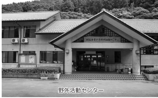
野外活動センター

青少年の心身の健全育成を図ることを目的とした教育施設となっており、現状では野外活動等のプログラムを実施しない宿泊のみの利用は難しいが、市外の利用者が市内の観光施設に気軽に寄っていただけるよう、観光パンフレット等を直接お渡しするなど、集客を図っていききたい。また、家族や少人数でも利用しやすい