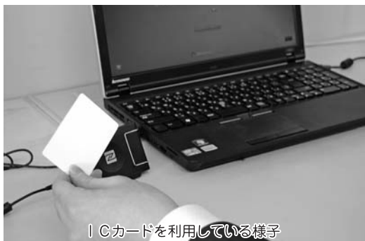
ICカードを利用している様子

技術の発達の機関の実証実験なども参考にしながら、情報収集に努めるとともに、費用対効果を含めて研究・検討が必要と考えている。