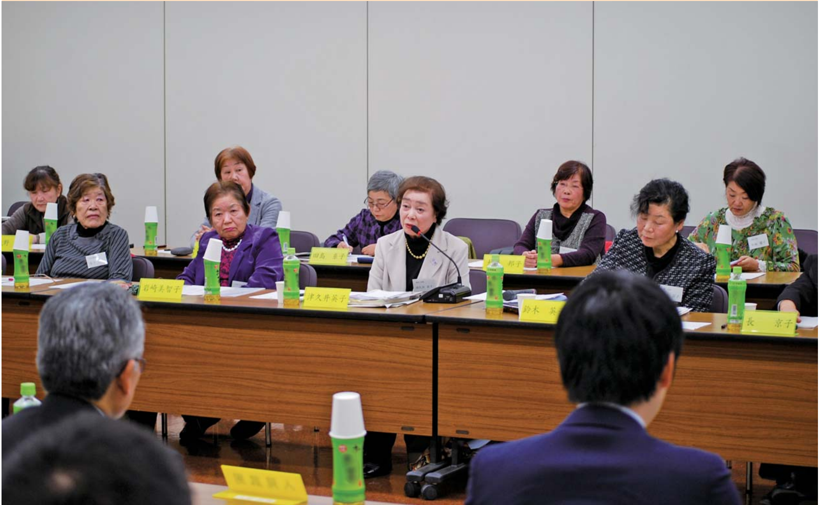
桐生市婦人団体連絡協議会とのまちづくり討論会