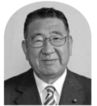
関 口 直 久 (日本共産党議員団)