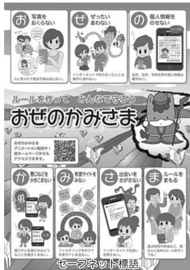
セーフネット標語

市内の小・中学生を集めた「桐生市いじめ防止子ども会議」において桐生市の児童・生徒が考えた「ネットいじめを起さなないためのルールやマナー」を採択し、各学校で配付している。