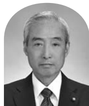
正男 庄 (そうぞう未来)