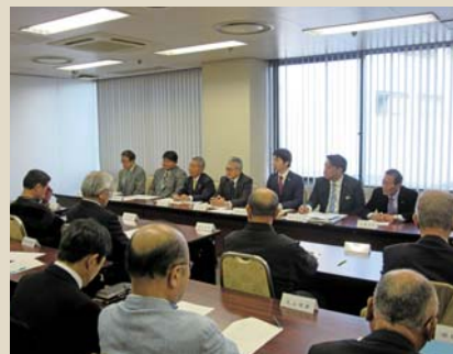
桐生市繊維振興協会への説明会の様子

※条例(案)は、議事課、広報課、新里・黒保根支所、市ホームページ(下記 URL 参照)にあります。