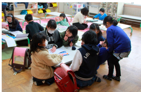
放課後児童クラブの様子

放課後児童クラブ事業は、仕事などのため保護者が昼間家庭にいない小学生を対象に、小学校の余剰教室などを利用して、適切な遊びや生活の場を提供し、児童の健全育成を図る事業です。現在、市内全ての小学校で実施していて、市が自治会関係者、小学校長、民生委員・児童委員、有識者、保護者の代表などで構成される運営委員会や社会福祉協議