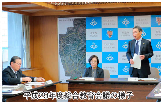
平成29年度総合教育会議の様子