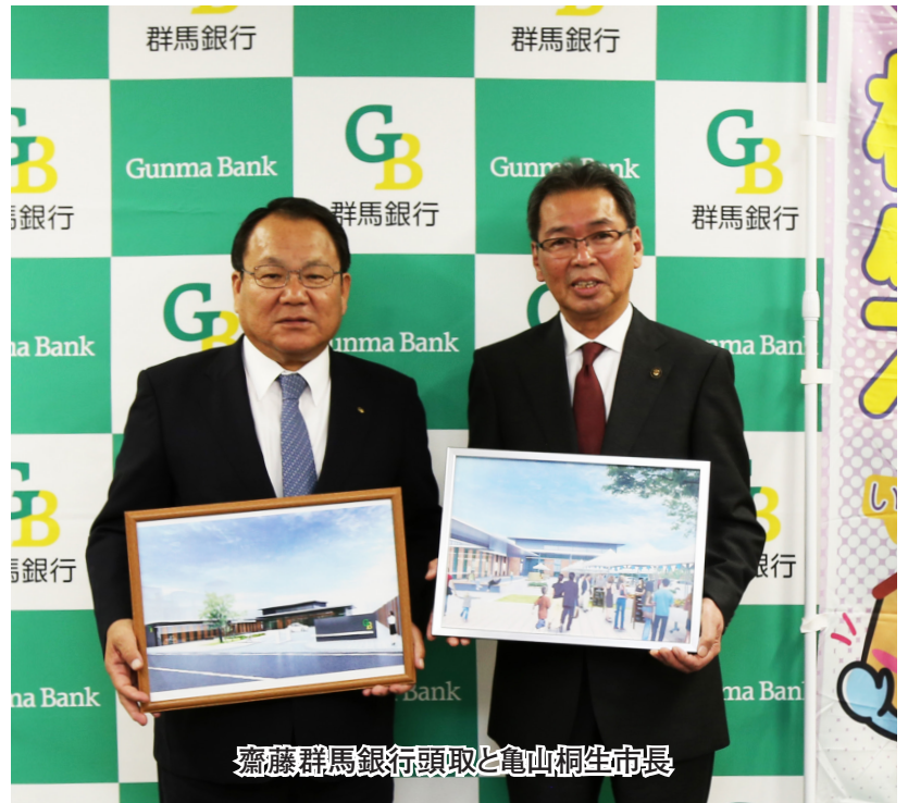
齋藤群馬銀行頭取と亀山桐生市長

市が活用する施設は、延べ床面積100平方メートルで、観光振興業務や観光案内、地元物産の販売などのほか、屋外の広場や駐車場では、イベントなどでの活用を検討しています。