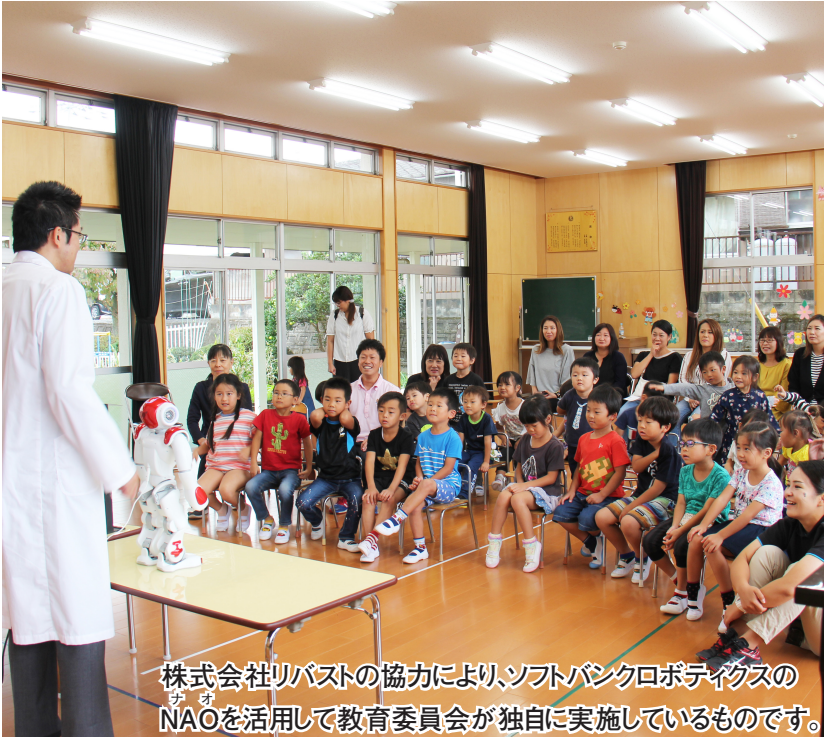
株式会社リバストの協力により、ソフトバンクロボティクスのNAOを活用して教育委員会が独自に実施しているものです。

園児は、サイエンスドクター（群馬大学大学院理工学部の大学院生）の話を静かに聞き、真剣なまなざしでロボットの動きを追っていました。