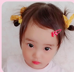
あかぎ 赤城 ここは 心春ちゃん

申し込み = Eメール (koho@city.kiryu.lg.jp) にお子さんの氏名（フリガナ）、生年月日、住所、保護者氏名、電話番号とお子さんへのメッセージ（40文字以内）を記入し、お子さんの画像データを添付の上、広報課（☎内線506）に申し込んでください。