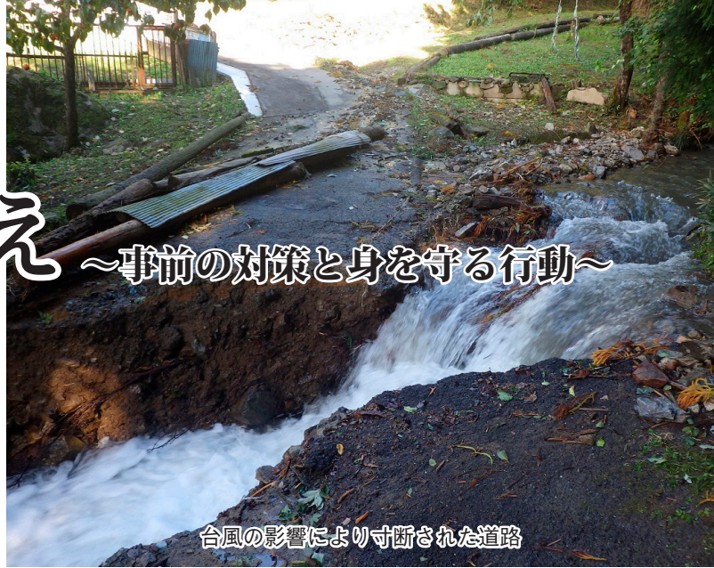
台風の影響により寸断された道路

平成29年10月の台風21号では、市内でも土砂の流入などによる被害がありました。台風に限らず、突然の大雨による河川の増水や土砂災害などに注意し、大雨時に河川や用水路を見に行くことは絶対にやめましょう。