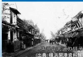
横浜弁天通の様子