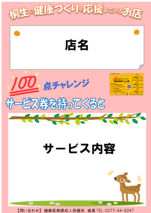
お店に掲示してもらふポスター イメージ (案)