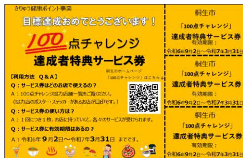
サービス券イメージ (案)