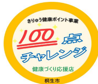
お店に掲示してもらふステッカー イメージ (案)

【問い合わせ】 桐生市保健福祉部 健康長寿課 成人保健係 電話：0277 (44) 8247