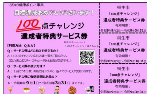
サービス券イメージ (案)