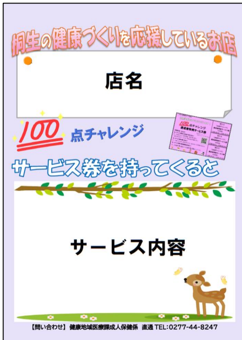
お店に掲示してもらおうポスター イメージ (案)