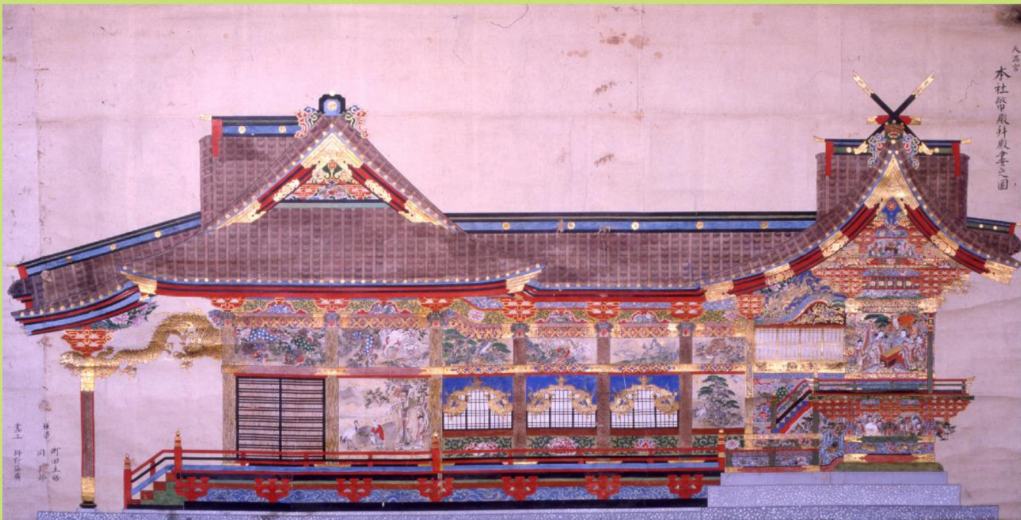
本殿幣拝殿妻之図