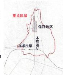
歴史的風致維持向上計画における重点区域

○ 日本遺産の構成文化財としての位置づけ 保存地区は、平成24年11月に認定された日本遺産「かかあ天下ーぐんまの絹物語ー」の構成文化財の一つに位置付けされた。全国に対しても地域の歴史的魅力や特色を発信する機会となり、地区の保存に対する一助となっている。