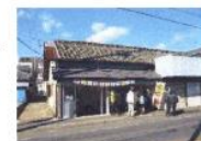
町屋を活用した市「町屋マルシェ」