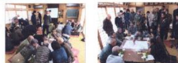
防災ワークショップの様子