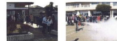
避難・消火訓練の様子

地域の防災に対し、地元住民が主体的に係る仕組みとして、自主防災会が組織されている。自主防災会では、防災意識の向上を図るため防災訓練を実施したり、市が行う防災対策事業などにも協力している。