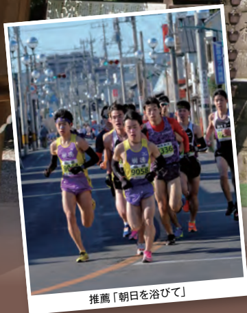
推薦「朝日を浴びて」