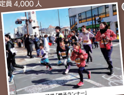
特選「親子ランナー」