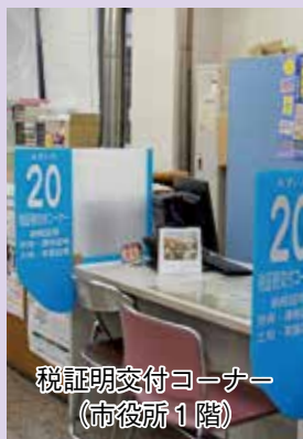
税証明交付コーナー (市役所1階)